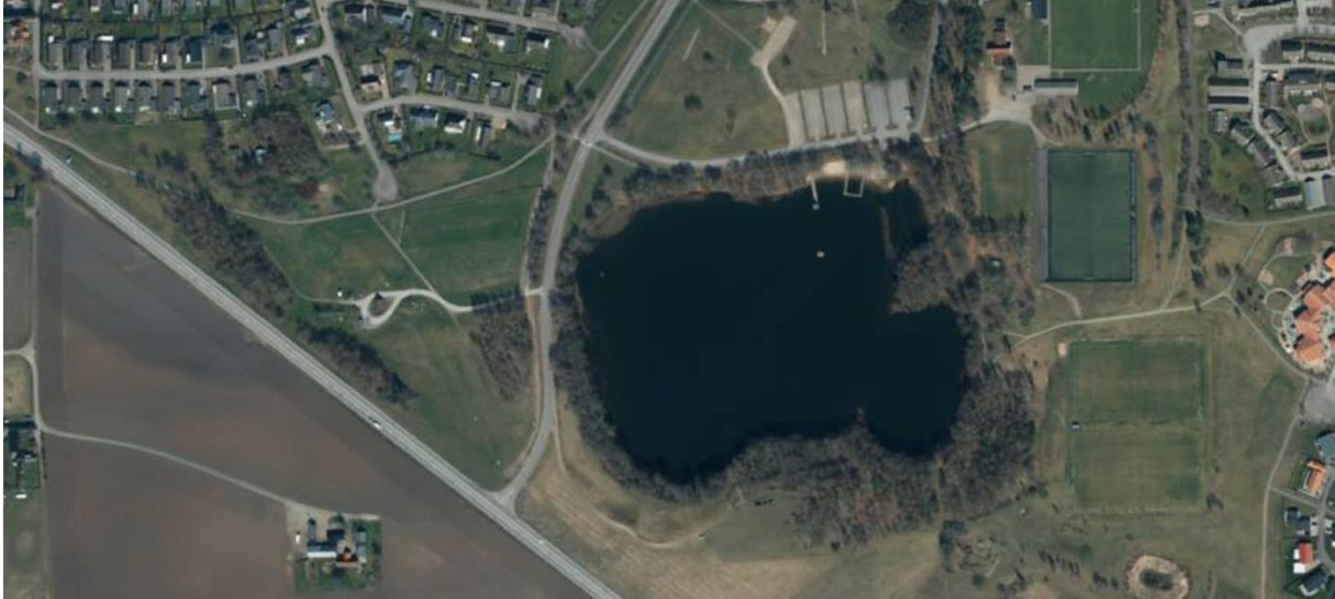
Glänninge sjö samt idrottsplats.

Som synes på bilden nedan är planen belägen inom ett kort avstånd, strax till höger om Glänninge sjö.