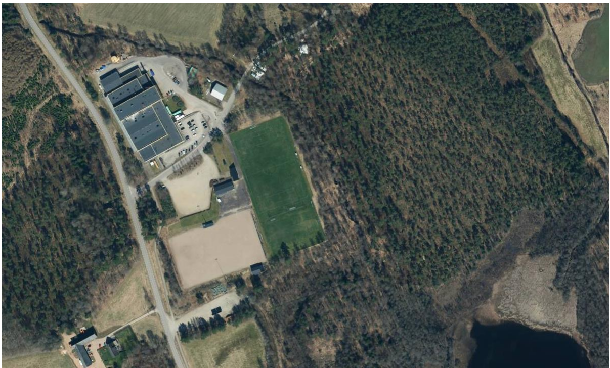
Idrottsplatsen Torulund i Torup, satellitbild.

I nuläget finns en fullskalig 11-mannaplan och en 7-mannaplan för fotboll på Torulund, bägge har naturgräs. Dessutom finns en grusplan med belysning på idrottsplatsen som används av Torups BK. Norr om idrottsplatsen finns en industrianläggning med inriktning på tvätt.